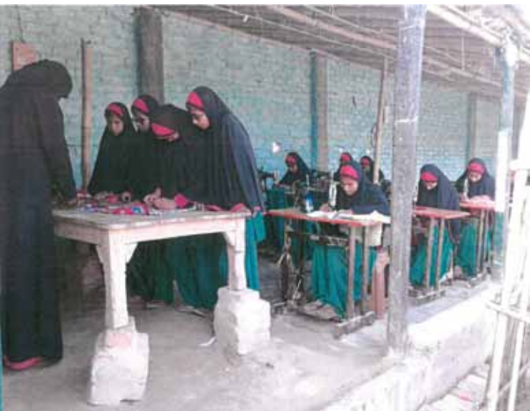
Jamia Tailoring Class