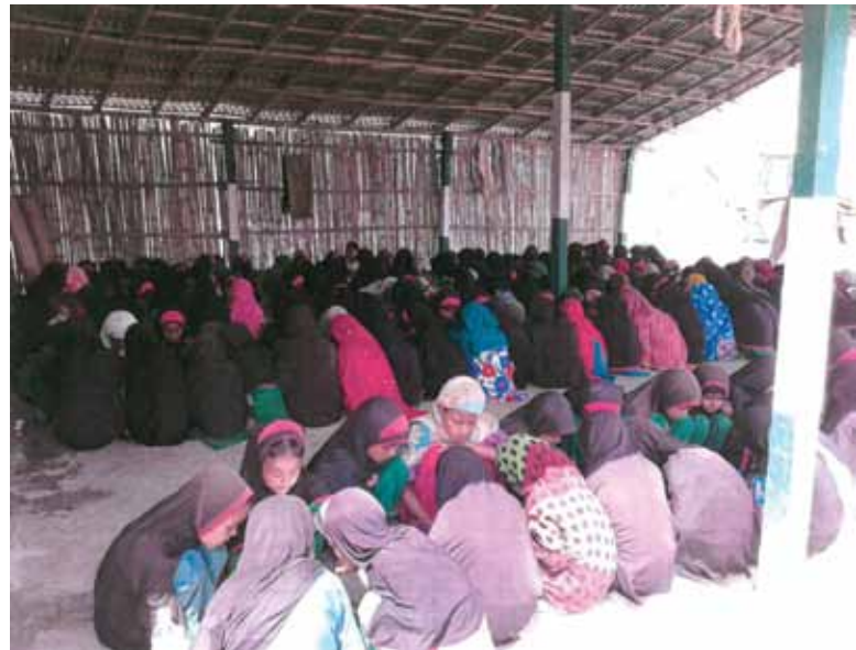
Students lined up for lunch in the dining hall, where they are taking lunch together, Jamia afford minimum 675 students every day.