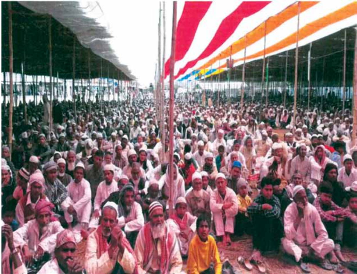
Opening ceremony of building of Jamia & School attended by Senior Islamic Scholars (ulama) and a large gathering of the public in 2008 (in the vast campus of Jamia)