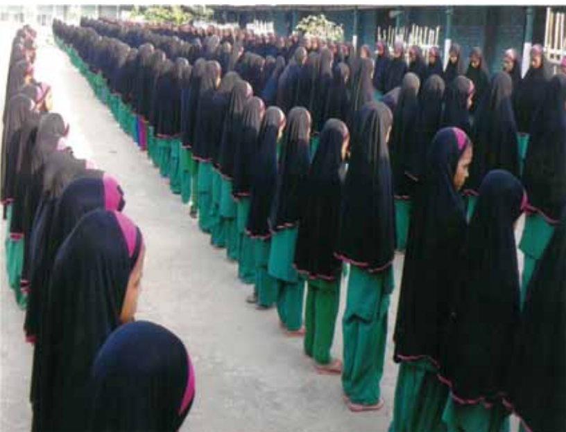
Students Of Jamia Reciting Hamd Sana In The Morning Period