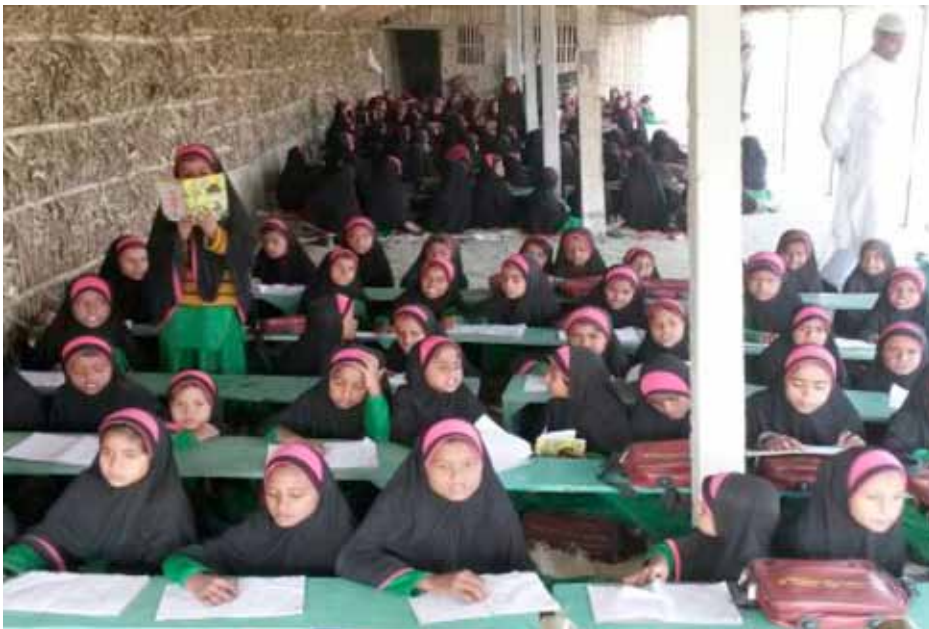
Students of starting three class of Jamia