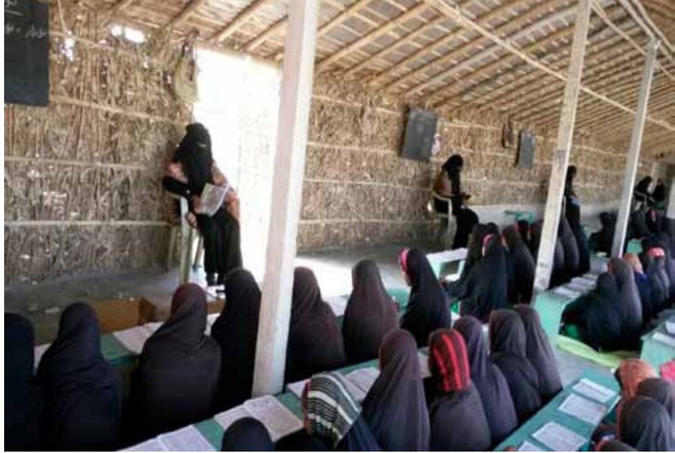
Students of starting three class of Jamia