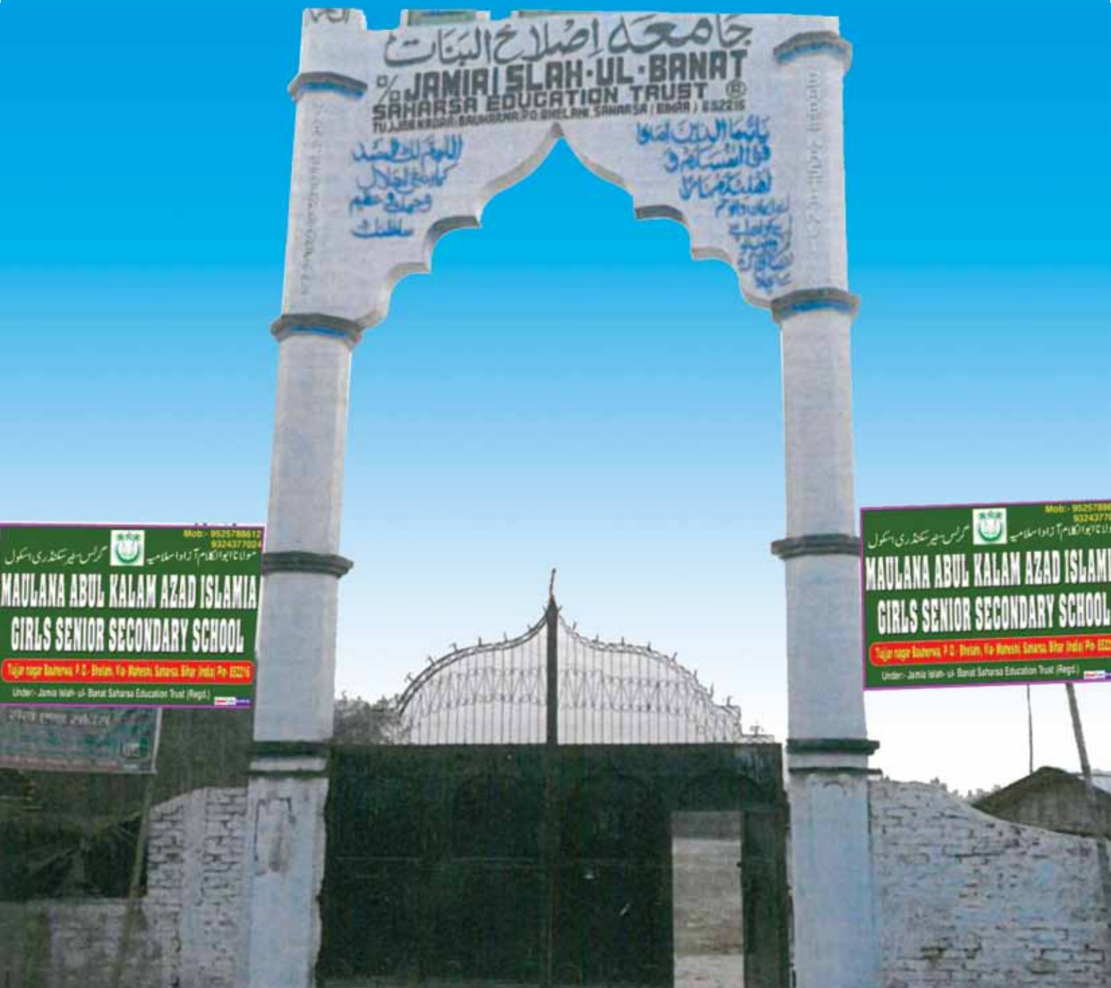
Main gate of Jamia along with wall compound